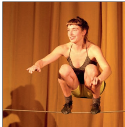
Dernière image du film : l'entrée en scène !